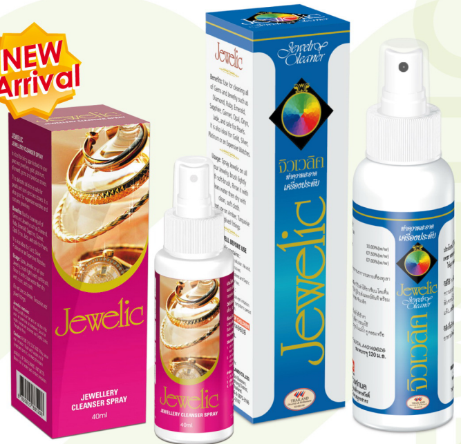
จิวเวลิก สเปรย์ 40 มล.